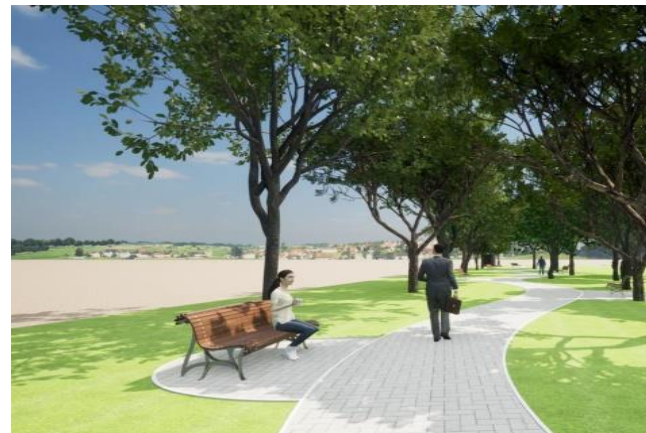
Проект Калязинского р-на