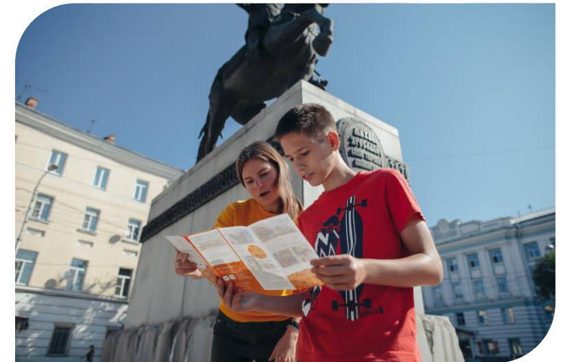
Пешеходная экскурсия по Твери