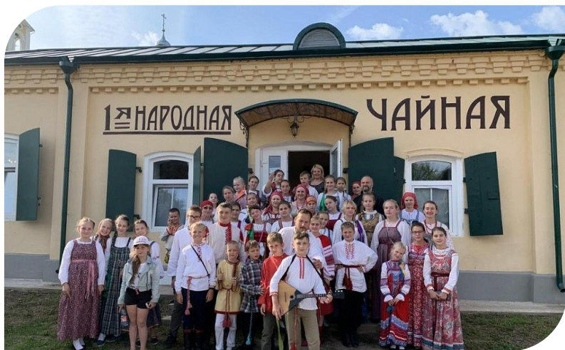
Туристический комплекс «Замытье»