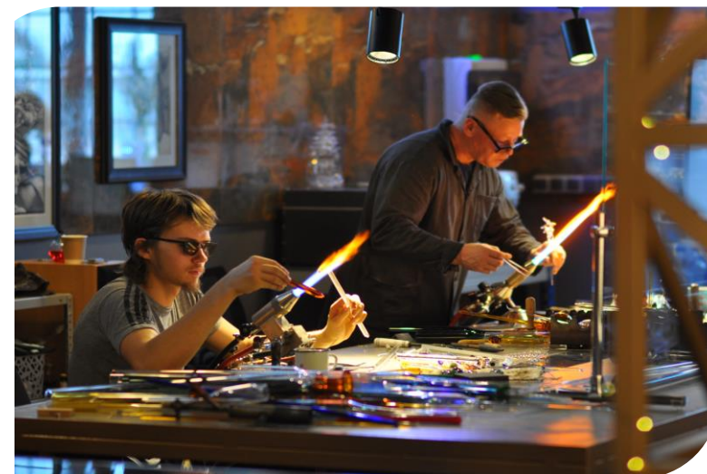
Музей стекла, Калининский район