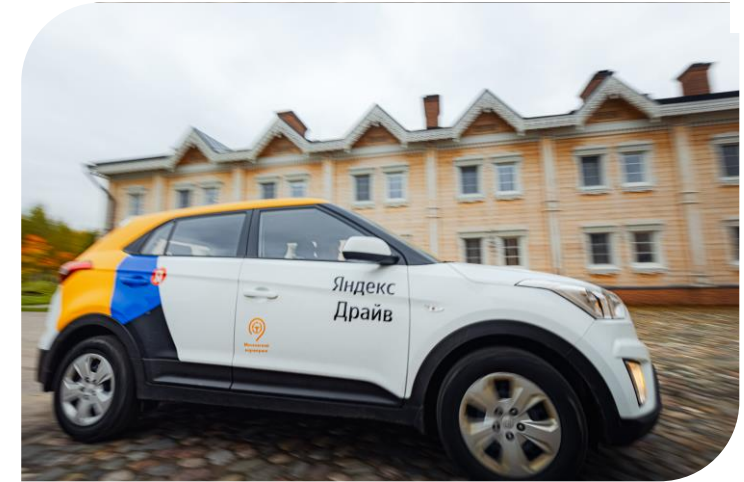
Путешествие на автомобиле