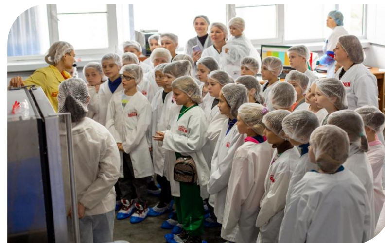
Экскурсия для школьников, г. Тверь