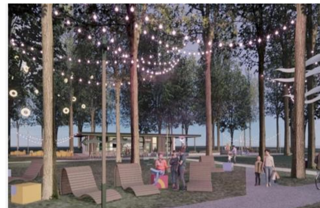
Проект Весьегонского м.о.