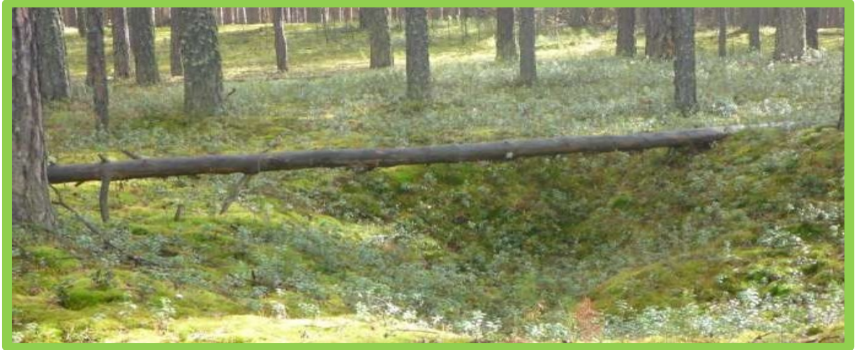
Изображение № 3 Валежник